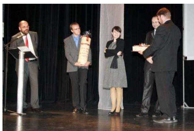
Oslavy 20. výročí ZIPCEM SR 28.-30.zář 2012 Prievidza