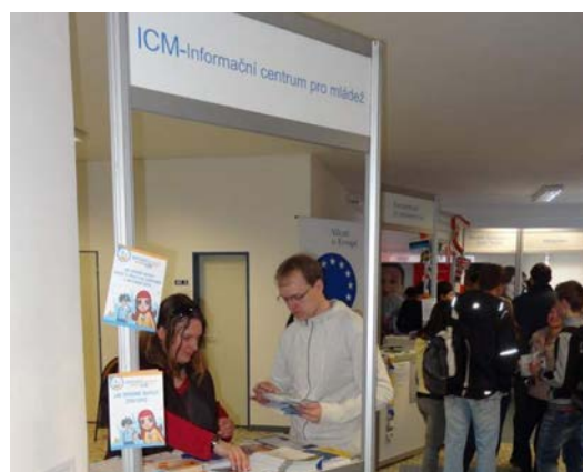
Job Day 27.března 2012 České Budějovice