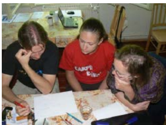
Česko – slovenské vzdělávací setkání 14. – 17.června 2012 Zátoň