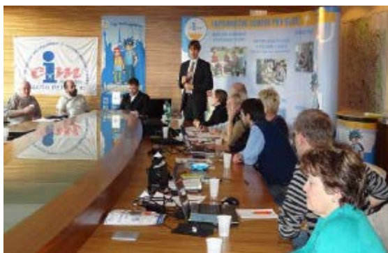
Valná hromada AICM ČR 14.-15.března 2012 Hradec Králové