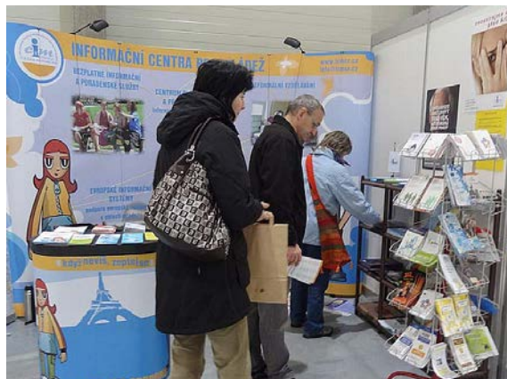
Vzdělání a řemeslo 21.-23.listopadu 2012 České Budějovice