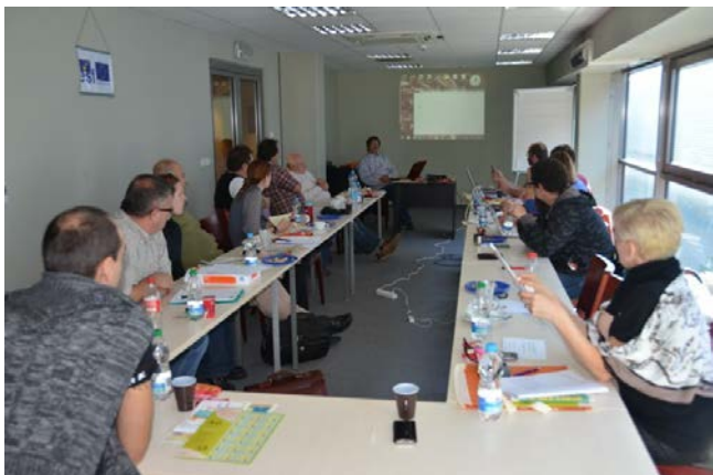
EDUCA MY JOB 2012 18.-20.října 2012 Liberec