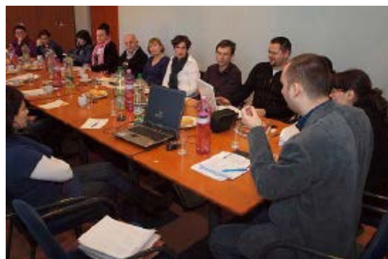
Valná hromada ZIPCEM 25.března 2012 Banská Bystrica