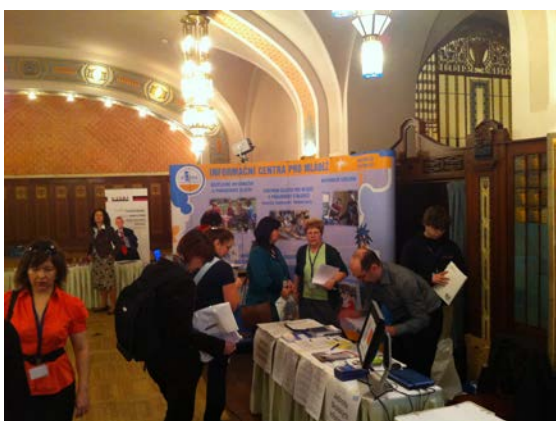
eSkills Week 26.března 2012 Praha