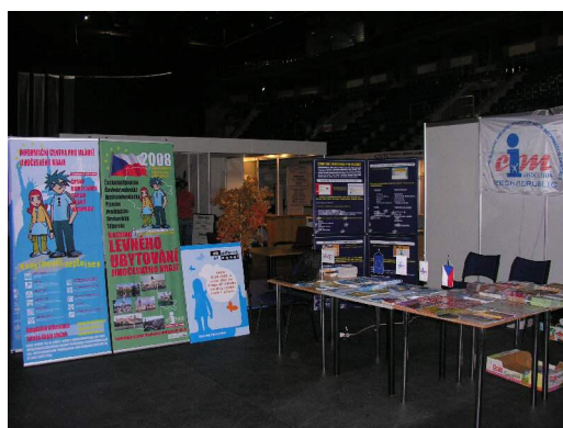
Foto z expozice na veletrhu EDUCA v Liberci

Veletrh „Učeň, středoškolák, vysokoškolák“ 7.- 8.12.2007 Ostrava