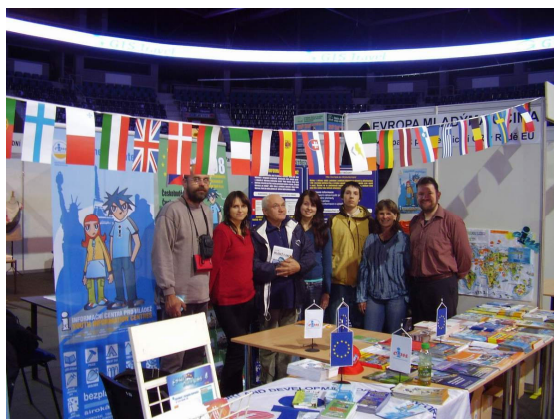
Foto z expozice na veletrhu EDUCA v Liberci

Na přípravě stánku, zajištění expozice po dobu výstavy a finanční účasti se podíleli kromě AICM také ICM Č.Lípa, DDM Liberec, ICM Liberec, Jablonec nad Nisou, Frýdlant, Hradec Králové, Teplice a Lomnice nad Popelkou. Výstava byla realizována v rámci projektu Evropa mladýma očima.