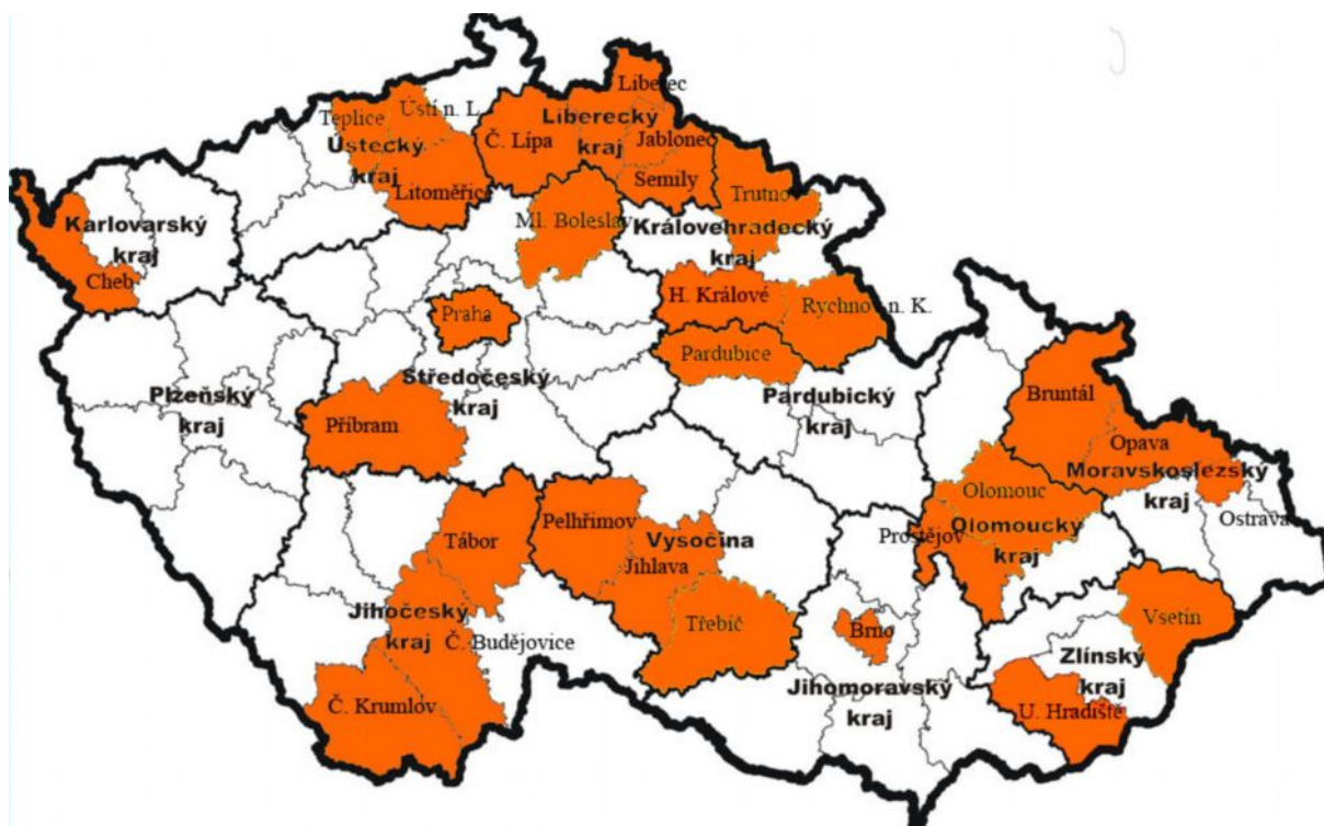
Mapa č. 1 – pokrytí ICM v jednotlivých krajích ČR